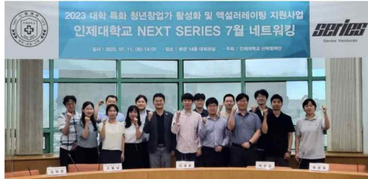
인제대 산학협력단이 김해캠퍼스에서 '대학 특화 청년창업 활성화 지원사업 네트워킹 행사'를 열었다.