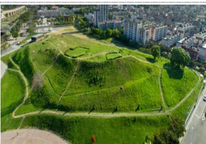
▲ 김해 대성동 고분군 (경남)