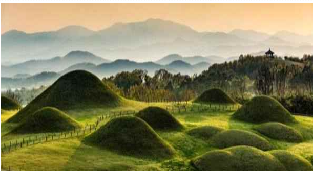
▲ 창녕 교동과 송현동 고분군 (경남)