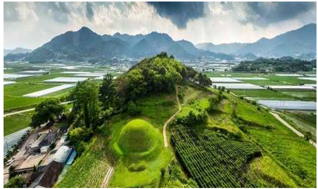
▲ 남원 유곡리와 두락리 고분군 (전북)