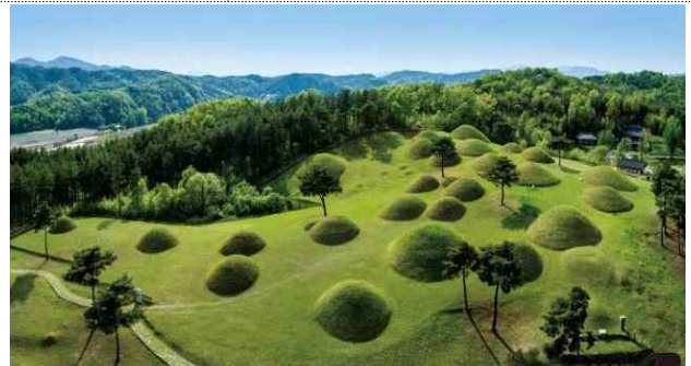
▲ 합천 옥전 고분군 (경남)