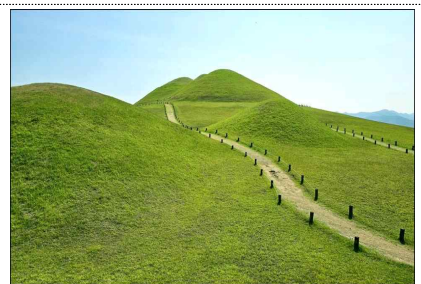
▲ 고성 송학동 고분군 (경남)