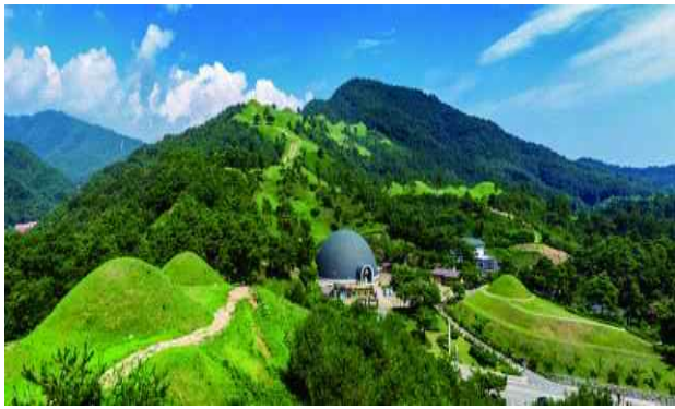
▲ 고령 지산동 고분군 (경북)