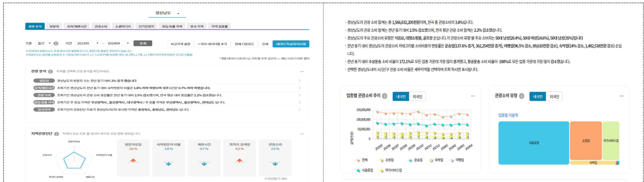
출처: 한국관광 데이터랩(경상남도 주요 관광소비 추이) / 기간설정: 2023. 5. ~2024. 4.)

② 최근 1년 동안 경상남도 관광지 관광소비가 줄어들고 있는 추세이며 전체적으로 쇼핑업의 비율이 낮음